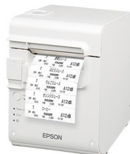
キッチンプリンター