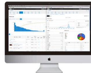
各種設定業務・閲覧・編集・DL・分析