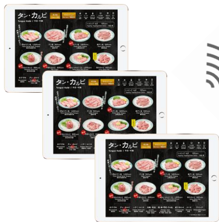
セルフオーダー用iPad