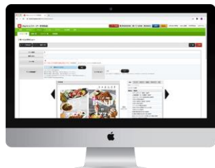
各種設定業務・編集・動画投稿